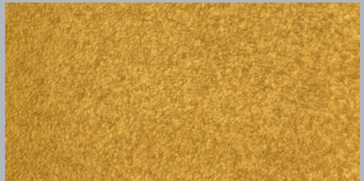
Gerollt: 2 mm Putz, 2x GoldGrund, 2x CapaGold

Weitere Informationen können Sie den Technischen Informationen Nr. 814 und Nr. 815 entnehmen.