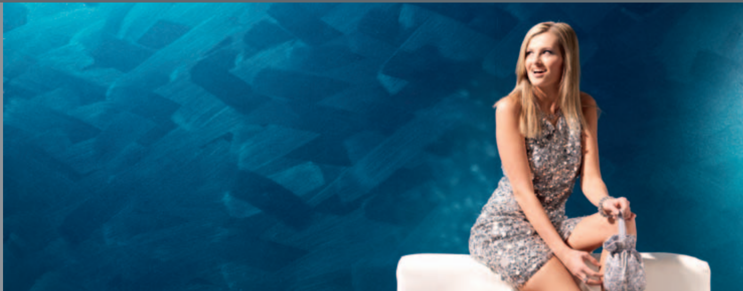
Wandfläche: 1x Amphibolin 3D Pacific 155 MET im Kreuzschlag gebürstet, 2x Metallocryl 3D Pacific 155 MET im Kreuzschlag gebürstet

Metallische Oberflächen für glänzende Perspektiven